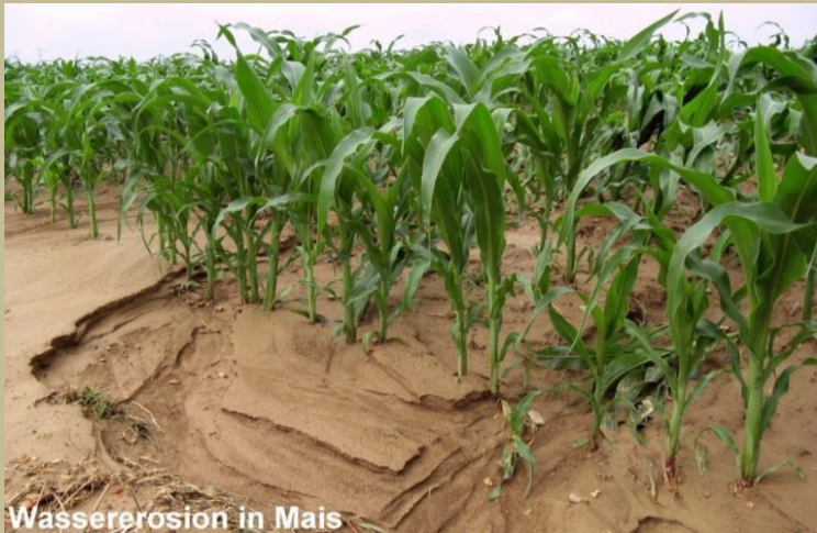
Wassererosion in Mais