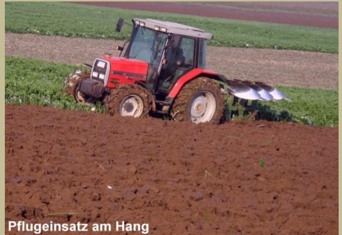
Pflugeinsatz am Hang

ACHTUNG: Neue Berechnung der Erosionsgefährdung seit 2019 - Bitte prüfen Sie Ihr Flurstücksverzeichnis!