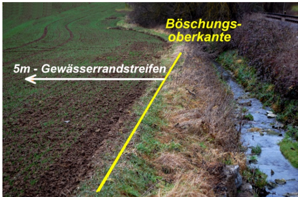
Abb.1: Gewässerrandstreifen: Die Bestimmung des 5 m-Bereichs ab Böschungsoberkante für das Verbot des Einsatzes und der Lagerung von Dünge- und Pflanzenschutzmitteln neben einem Gewässer von wasserwirtschaftlicher Bedeutung.

Hintergrund ist insbesondere das Ziel, mit einem Pufferstreifen stoffliche Einträge zu verringern. Die fünf Meter-Regelung gilt für Gewässerrandstreifen an Gewässern von wasserwirtschaftlicher Bedeutung; das sind in den meisten Fällen die Gewässer erster und zweiter Ordnung. Auskünfte dazu erteilen die unteren Wasserbehörden an den Landratsämtern. Für den Bewirtschafter ist im konkreten Fall eine erste Orientierung anhand des Amtlichen Digitalen Wasserwirtschaftlichen Gewässernetz (AWGN) möglich (Abbildung 2). Dieses digitale Kartenwerk ist über das Internetangebot der Landesanstalt für Umwelt, Messungen und Naturschutz Baden-Württemberg (LUBW) allgemein zugänglich unter www.lubw.baden-wuerttemberg.de . Bei der Anwendung von Pflanzenschutzmitteln in der Nähe von Oberflächengewässern sind bereits seit einigen Jahren je nach Wirkstoff, Aufwandmenge und Applikationstechnik gestaffelte Abstandsauflagen zum Gewässer einzu-